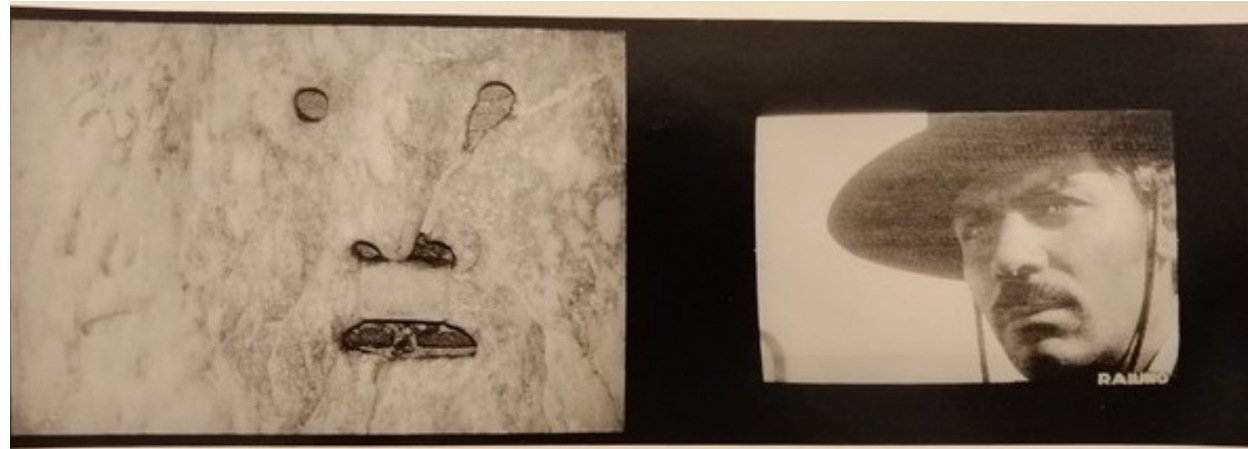
BOCCA DELLA VERITÀ fotografia vintage