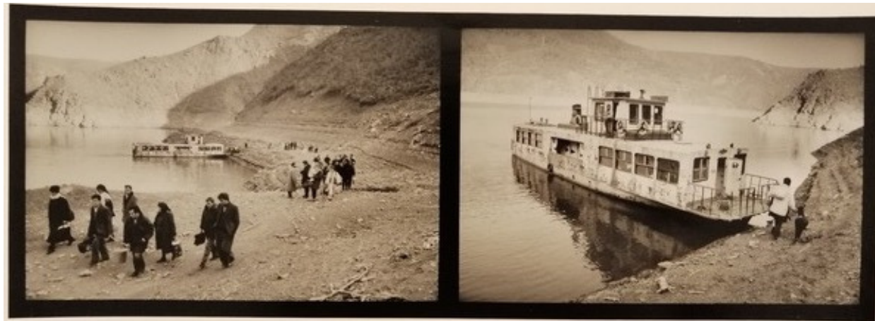
ALBANIA fotografia vintage