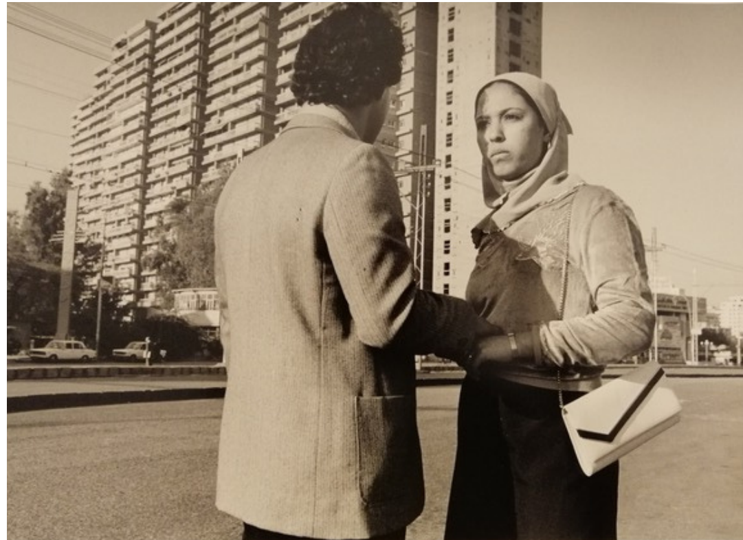
SUBITO DA LEI fotografia vintage

Tingasas, Svezia, 1952 Vive e lavora in Italia