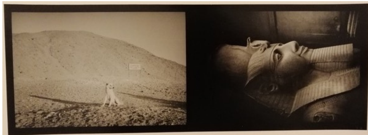
CANE E EGITTO fotografia vintage