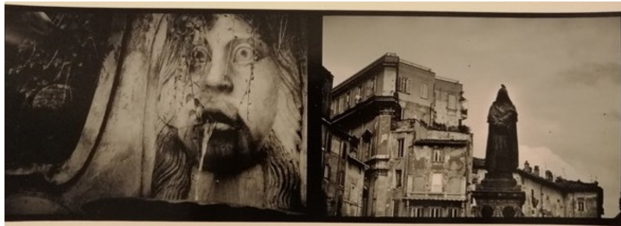
ROMA GIORDANO BRUNO fotografia vintage