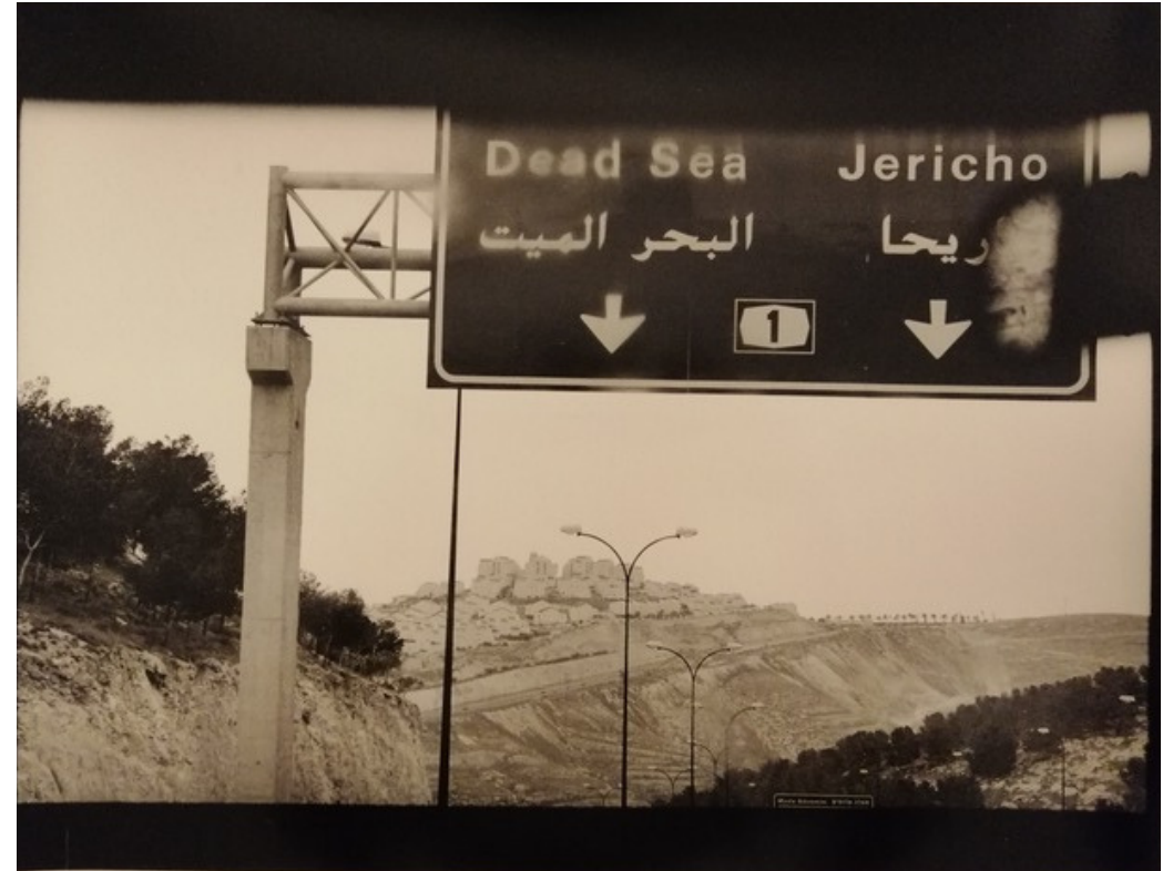
DEAD SEA JERICHO fotografia vintage