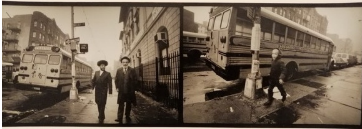
BROOKLYN fotografia vintage