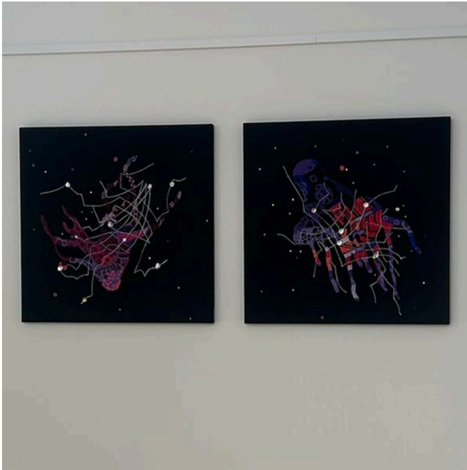
Gisella Chaudry, due elementi della serie Traiettorie, 2022 cotone e pietre