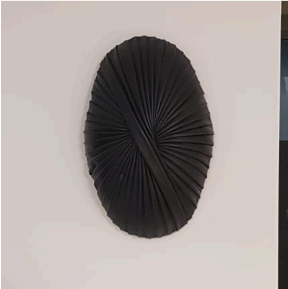
Federica Zianni, Oval Cocoon, 2023 legno, schiuma poliuretanică e camere d'aria