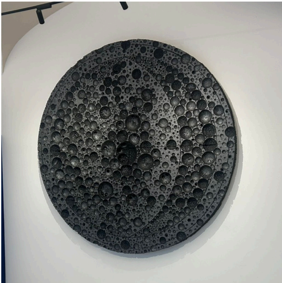
Gisella Chaudry, Punto di contatto, 2025 polistirolo strinato termoformato con mestoli da cucina cm 200x200x10