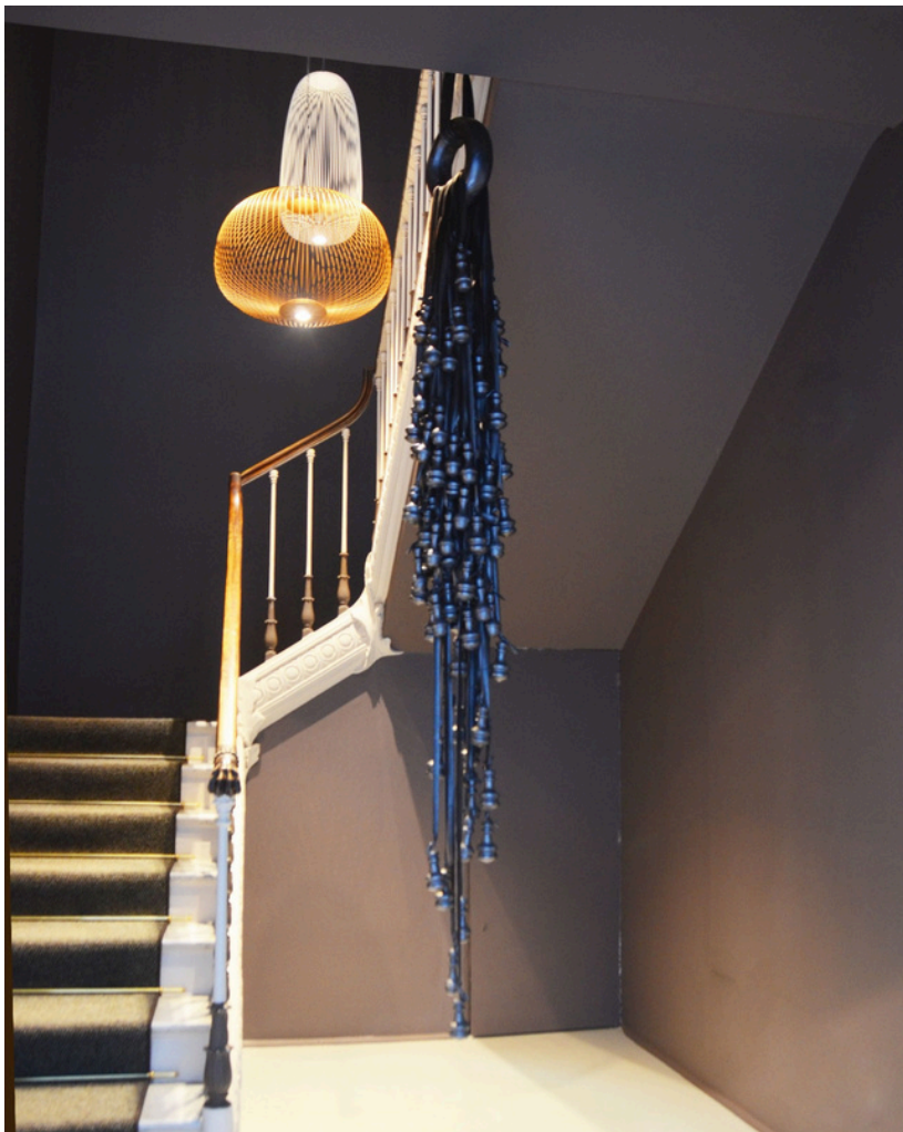
Federica Zianni, Unbalanced Scale, 2024 mista, gesso e camere d'aria 25x25x300 cm