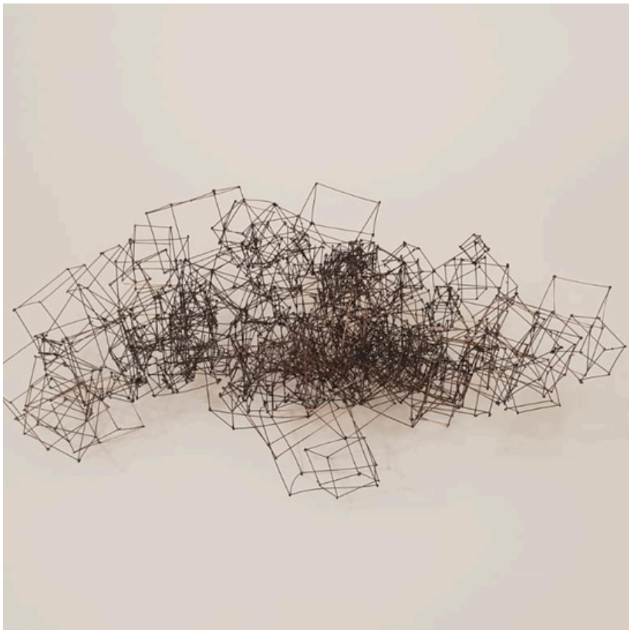
Jacopo Mandich, Nuvola quantica, 2022 ferro